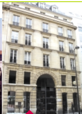
Site de Paris