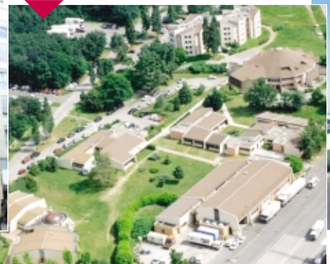
Site de Villette d'Anthon