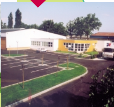
Site de Bischheim (Strasbourg)