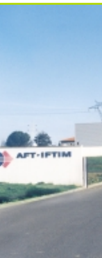
Site de Lyon