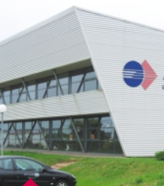
Site de Metz