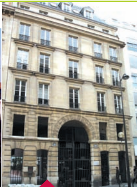
Site de Paris