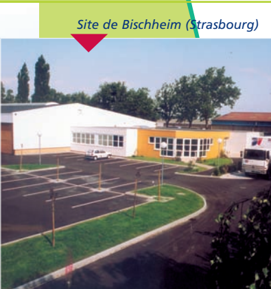
Site de Bischheim (Strasbourg)