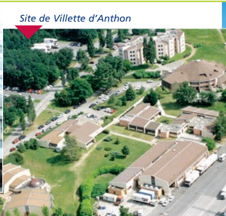
Site de Villette d'Anthon